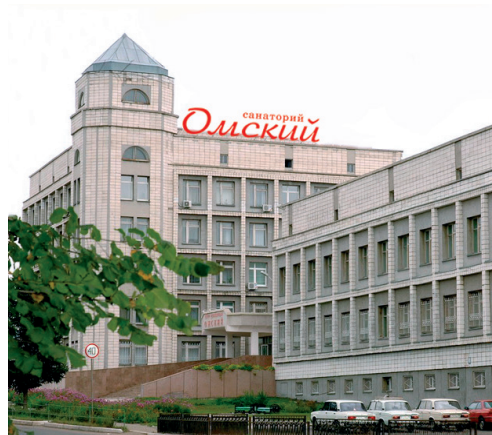
Рис. 2. Приточная система вентиляции в здании «Омский санаторий»