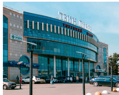
Рис. 1. Приточная система вентиляции в центре «Твин Плаза»