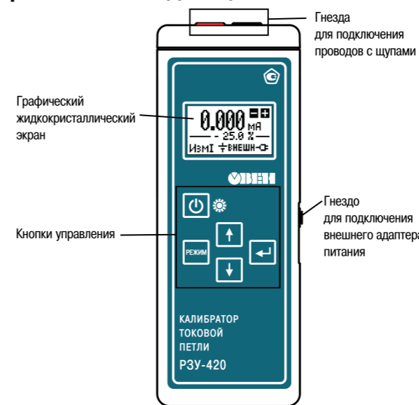
Рисунок 1 – Внешний вид прибора

На лицевой поверхности прибора имеется графический жидкокристаллический экран и 5 кнопок управления.