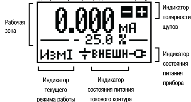
Рисунок 2 – Экран прибора

Внешний вид экрана прибора представлен на рисунке 2 .